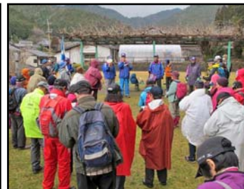
せっかくウォーク(9日)